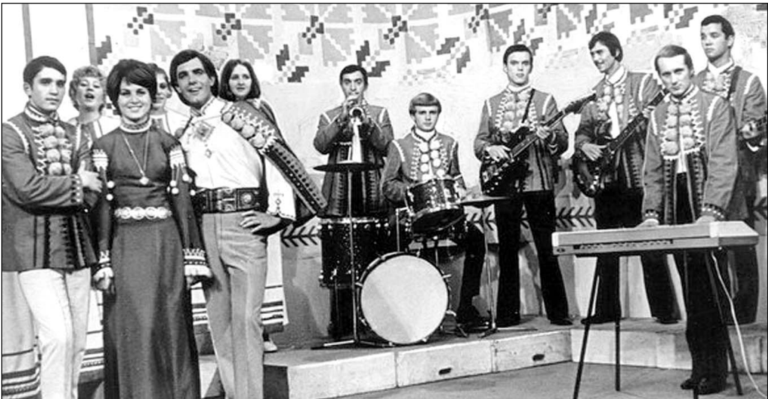
ВІА «Смерічка». 1970 рік.